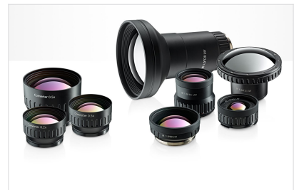
8 optional lens for maximum versatility.